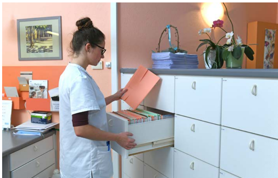
➤ Dopo ogni consultazione, le cartelle dei pazienti vengono aggiornate.

«Per il futuro vorrei continuare per un po' a esercitare questa professione e poi svolgere una formazione continua», aggiunge la giovane. «Ci sono diverse